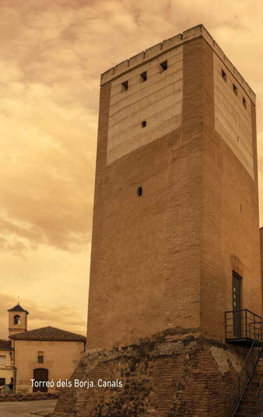
Torreó dels Borja. Canals