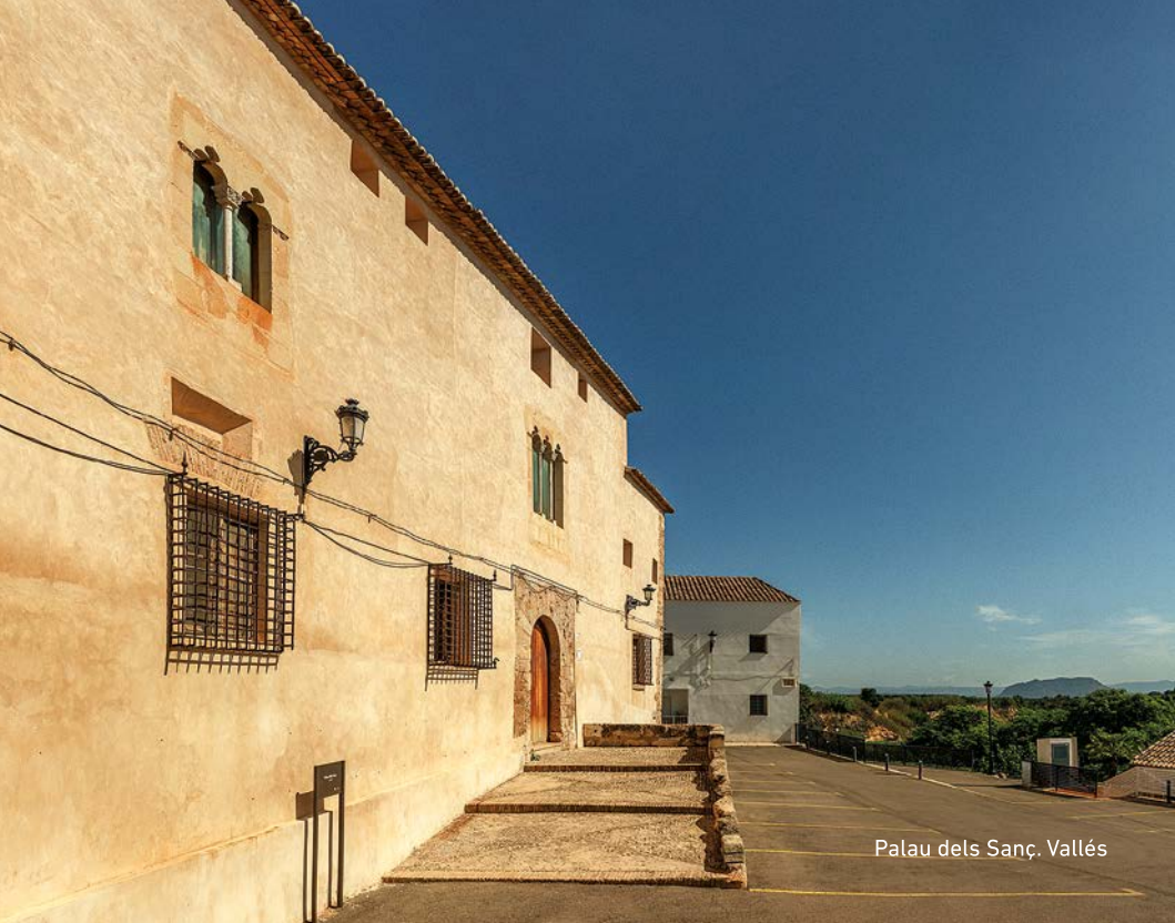
Palau dels Sañç. Vallés