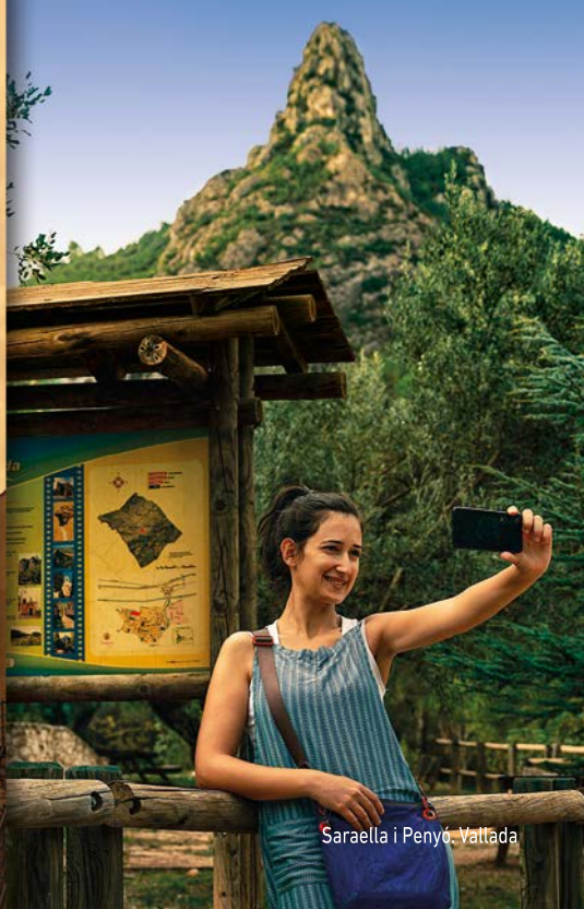
Saraella i Penyó. Vallada