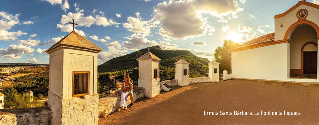
Ermite Santa Bárbara. La Font de la Figuera