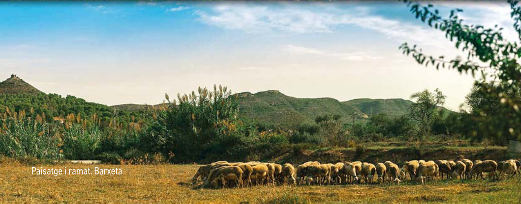
Paisatge i ramat, Barxeta