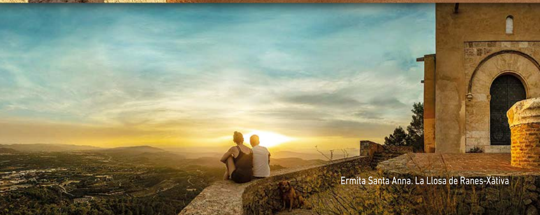
Ermite Santa Anna. La Llosa de Ranes-Xàtiva