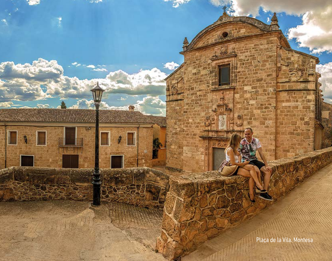
Plaça de la Vila, Montesa