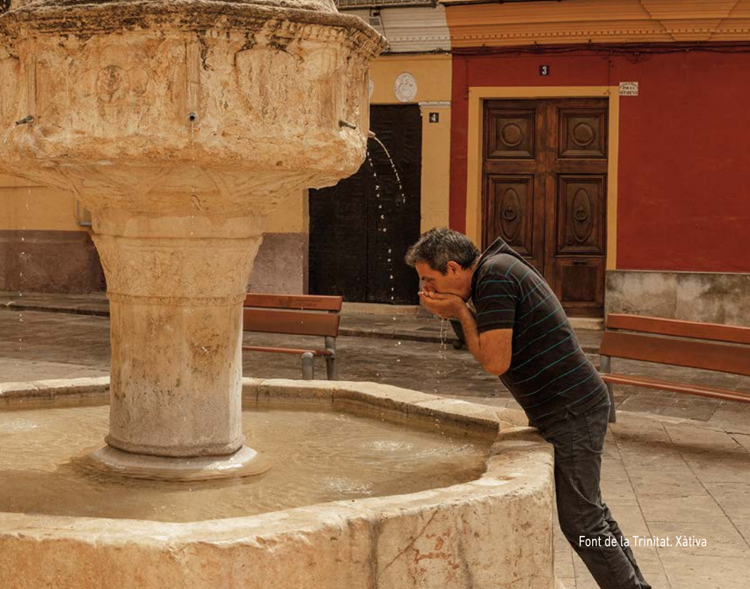
Font de la Trinitat. Xàtiva