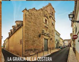
LA GRANJA DE LA COSTERA