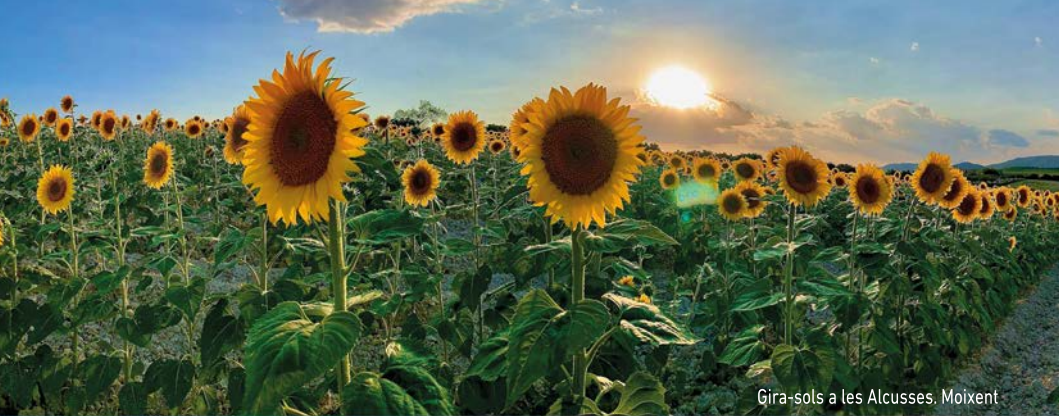
Gira-sols a les Alcusses, Moixent