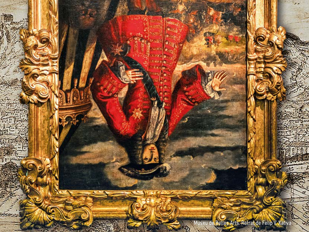
Museu de Belles Arts. Retrat de Felip V. Xàtiva