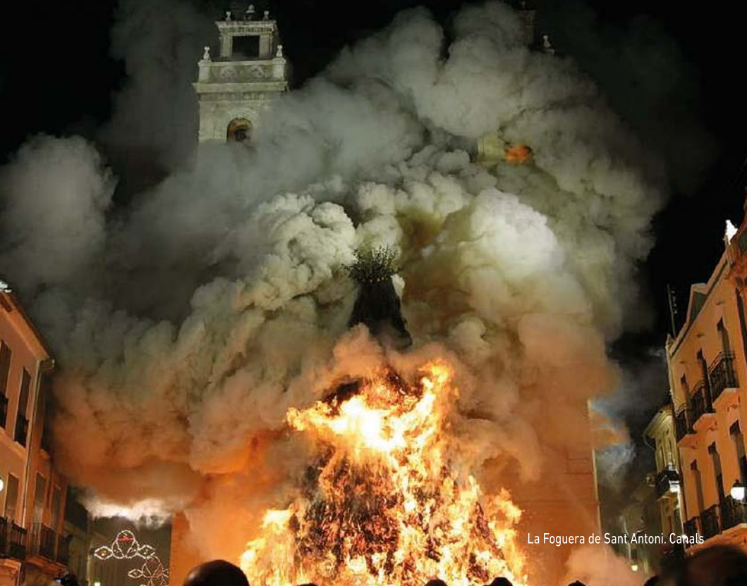
La Foguera de Sant Antoni. Canals