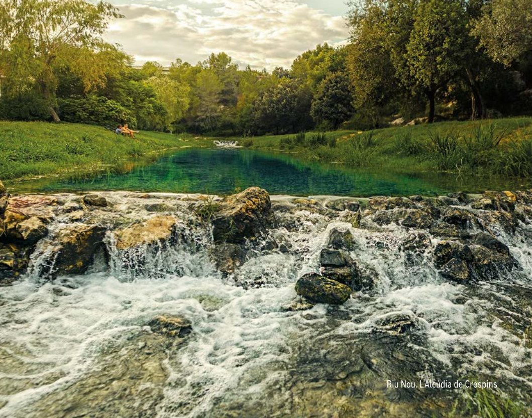
Riu Nou. L'Alcúdia de Crespins