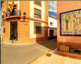
LLANERA DE RANES