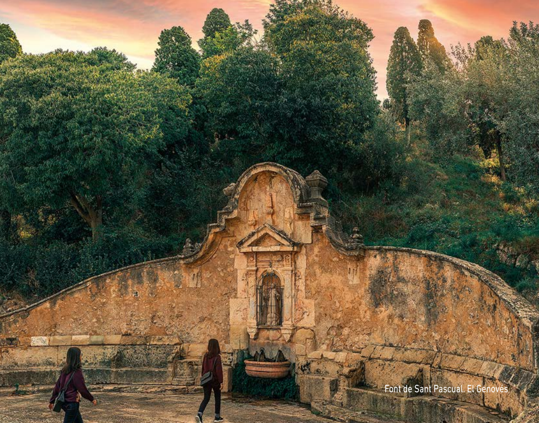
Font de Sant Pascual. El Genovès