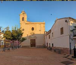
LLOC NOU D'ENFOLLET