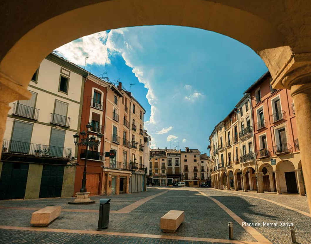
Plaça del Mercat. Xàtiva