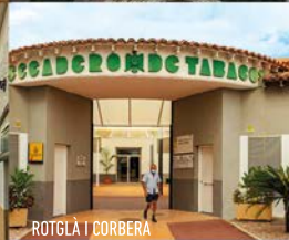
ROTLÀ I CORBERA